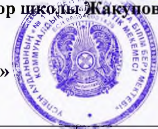
График проведения консультаций по подготовке учащихся 9-х классов КГУ «Успенская СОШ №1» к итоговым выпускным экзаменам в 2020 году.