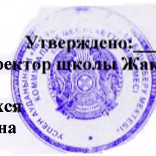
График проведения консультаций по подготовке учащихся 11 класса КГУ «Успенская СОШ № 1» Успенского района к итоговой аттестации 2019-2020 учебного года